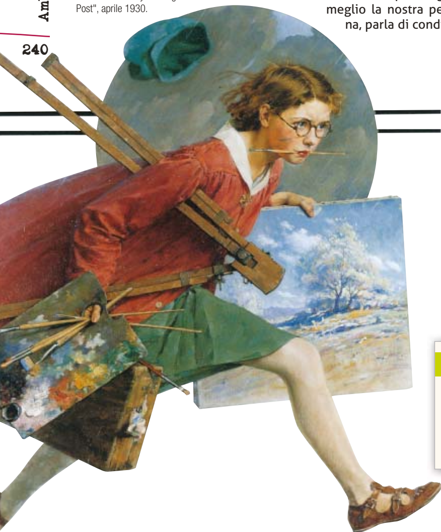
Norman Rockwell, Girl Running with Wet Canvas (Wet paint); collezione privata. Illustrazione per la copertina del "The Saturday Evening Post", aprile 1930.

Provate a fare un ragionamento su come oggi la tradizione influisce sulla formazione di una persona, sia attraverso gli insegnamenti che da essa l'individuo trae sia attraverso la sua trasgressione e il suo superamento. Se potete, fate esempi concreti.